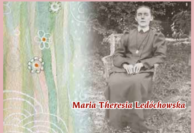
Maria Theresia Ledóchowska

“Hoe armer wij omwille van Christus worden, hoe meer geestelijke vreugde wij ontvangen.” MTL