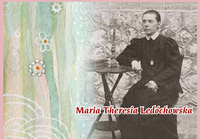
Maria Theresia Ledóchowska

“Overweging van het verborgen leven van Jezus, is voor onze zusters bijzonder van belang.” MTL