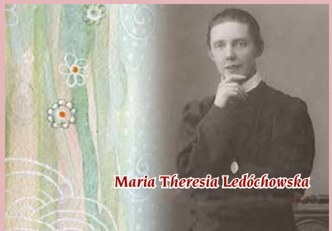
Maria Theresia Ledóchowska