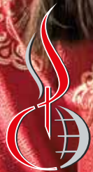
Mongolië, foto Giorgio Marengo